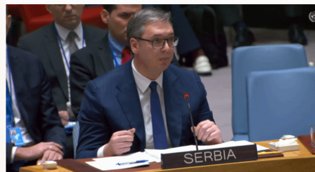
Autori: Gazeta InFokus 17:31 | 22 April 2024